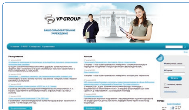
Используйте единый Портал для работы с информационными сервисами вашего образовательного учреждения

Для удобной работы пользователей с электронными ресурсами реализован сервис ведения каталога ЭОР и программного обеспечения, включающий следующие функциональные возможности: